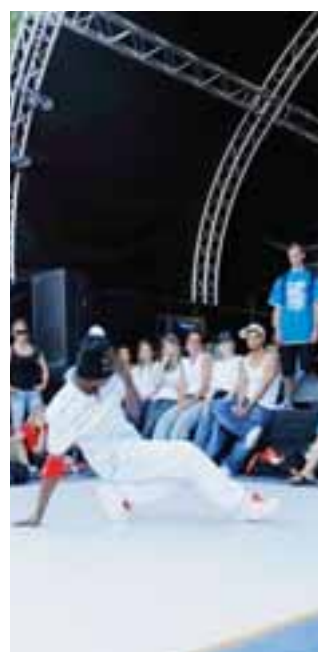
Breaktänzer zeigen an den X-Days ihr Können.

Um eine gute Atmosphäre zu gewährleisten, wird der Event alkoholfrei sein. Höhepunkte sind garantiert: Mit den zwei Schuttmulden, welche in ein Schwimmbad umfunktioniert werden, wird für Stadt-Strand- Atmosphäre gesorgt. Der höl- zerne «Cube» (das BT berichtete) soll die Innovation, die Kreativi-