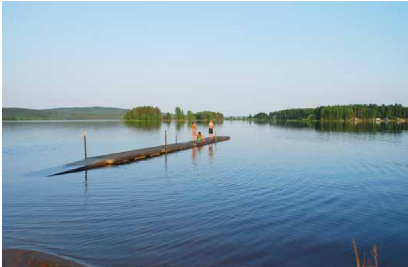
Das Siegerbild des Tages: «Schweden zur blauen Stunde», von René Müller, Lyss.